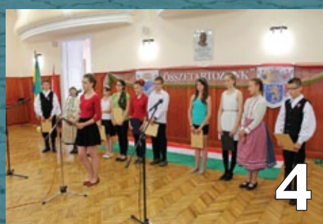
Emlékezés és ünnep