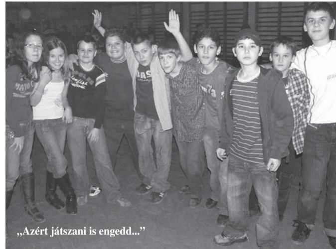
„Azért játszani is enged...”

kezdve a szülőn, pedagóguson, szakértőn át mindenki. És még egy fontos „sarokkő”: az egészséges médiakörnyezet megléte. Egy olyan milió, ahol a felnövekvő generációk igazi, előremutató, európai és magyar hagyományokat egészséges arányban egyesítő értékekkel találkoznak. Nem lehet nem észrevenni, hogy az audiovizuális kultúra térhódítása mennyire látványos. Ennek a „hódításnak” egyik legfőbb célcsoportja a fiatalság, akik az információkat az őket körülvevő világról főleg az elektronikus médiából szerzik, s így alakítják ki saját kis világukat. Márpedig a médiában ma Magyarországon minden jelen van (tisztelt az igen kevés számú kivételnek), csak az egészséges önkritika és -kontroll nem. Így pedig hiába várjuk el gyermekeinktől, hogy értékrendszerükben megközelítsék az általunk – felnőttek által – megfogalmazott normákat.