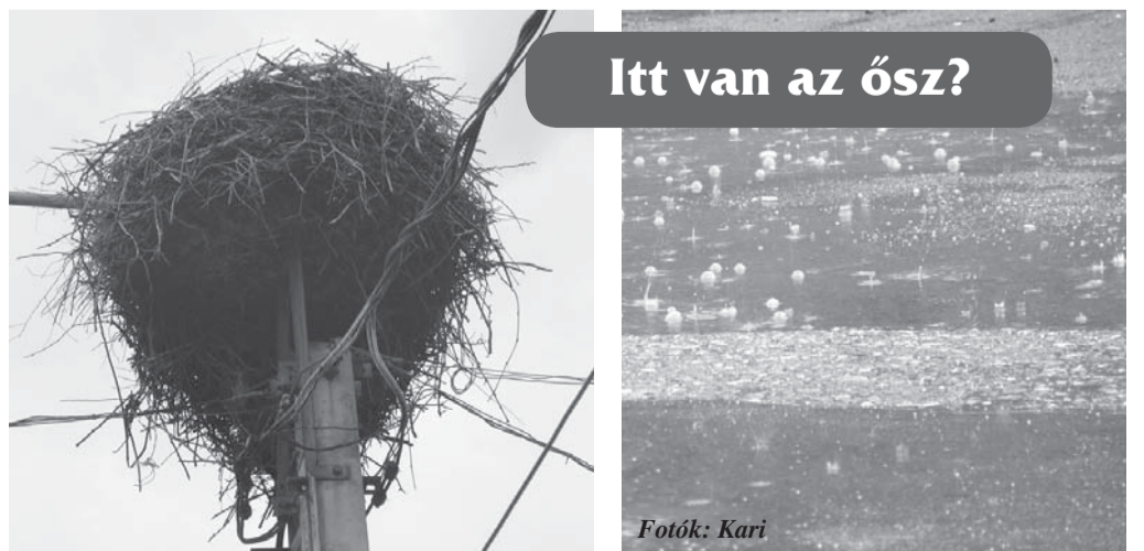
Itt van az ősz?