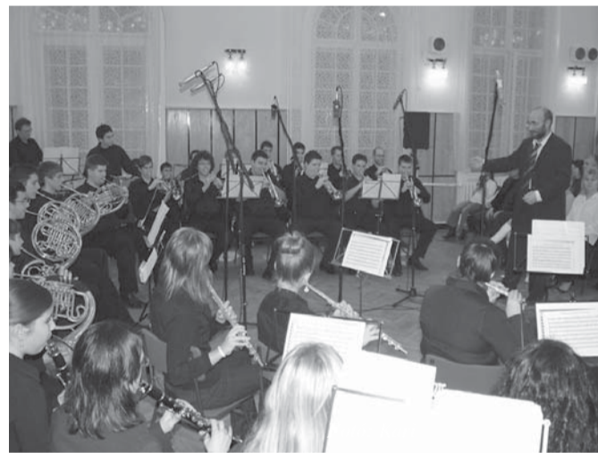
December 23-án karácsonyi koncertet adott a Városi Zeneiskola